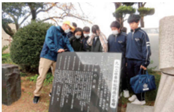
▲チェックポイントで地域の方からお話を聴く生徒

地域の歴史や文化、地域に貢献する方々の思いを味わいながら魅力を発見することを目的に生徒会が主体となって企画しました。今年は「防災」をテーマとし、水防倉庫や消防署などの防災に関わる16か所のチェックポイントを班ごとに分かれて巡りました。チェックポイントでは教員や地域の方々が出した問題を解いて得点を競いながら、地域の魅力や防災の大切さを学びました。