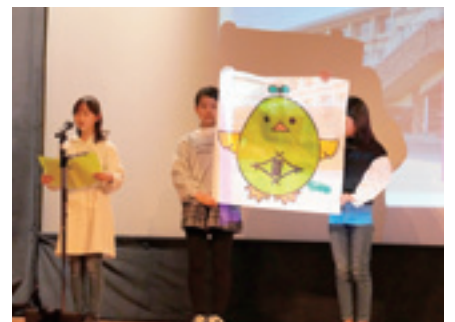
▲“ひなもり”の紹介（名森小学校）