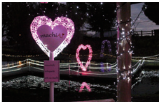
▲冬の夜を彩るイルミネーション