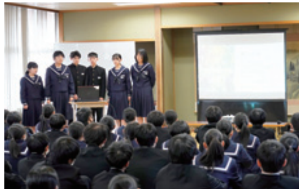
▲自分たちで考えたアイデアを発表する生徒

代表生徒は「将来私たちが大人になり町を支える立場になった時のために、よく知り、学び、自分たちになにができるか考えながら生活していきたいです」と話してくれました。