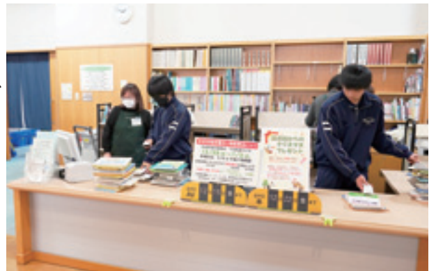
▲ハートピア安八窓口で仕事を体験する生徒

生徒たちは各事業所で接客マナーや商品整理、掃除など様々な体験をすることにより、働くことの楽しさや大変さ、やりがいを学ぶことができ、自分の将来を考えるよい機会となりました。代表生徒は「職場の方やお客様とのコミュニケーションや相手の気持ちを考えることの大切さを教えていただきました」と話してくれました。