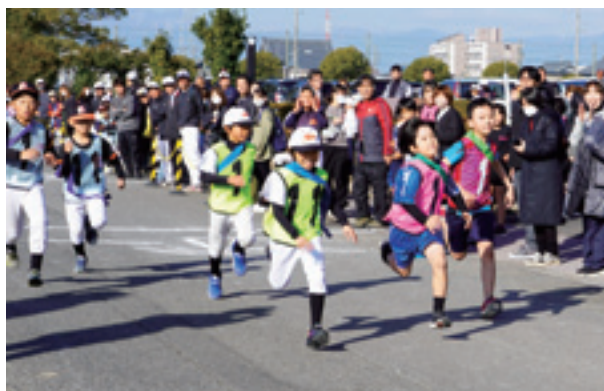
▲仲間へたすきをつなぎます

最後まで懸命に走りぬく選手へ、仲間や保護者の方から「頑張れ!」「あと少し!」などの応援の聲が会場に響き渡りました。