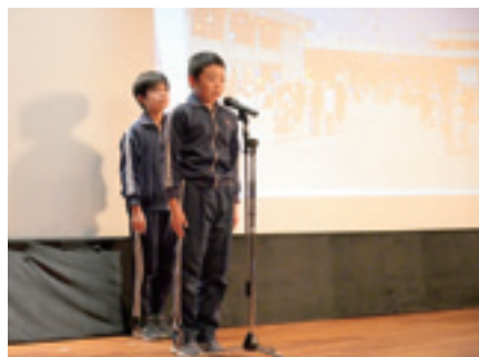
▲校歌の披露（牧小学校）