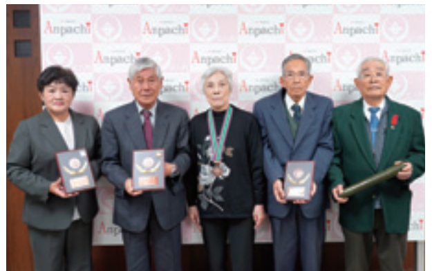
▲受賞者・受賞団体代表者の皆さま

長きにわたるボランティア等での善行実践活動を認められてこの度の受賞となりました。