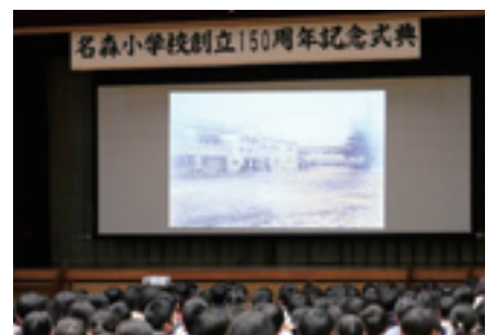
▲タイムスリップ写真館（名森小学校）

第2部では、瑞浪市にあるサイエンスワールドの方を講師に招いた科学マジックショーが行われ、児童は実験に参加しながら科学を楽しみました。