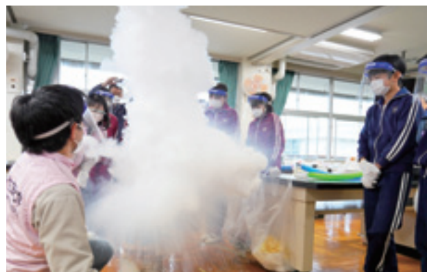
▲天井近くまで立ちのぼる人工の雲に驚く児童

代表児童は「いろんな実験ができて楽しかったです。化学について興味をもつきっかけになりました」と話してくれました。