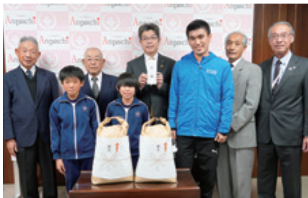
▲大事に育てた古代米を手渡しました

代表児童は「田植えや稲刈りは初めてで緊張したけど地域の方に教えてもらいながら、楽しくたくさん収穫することができました。全員で大事に育てた古代米を美味しく食べてもらえるとうれしいです」と話してくれました。